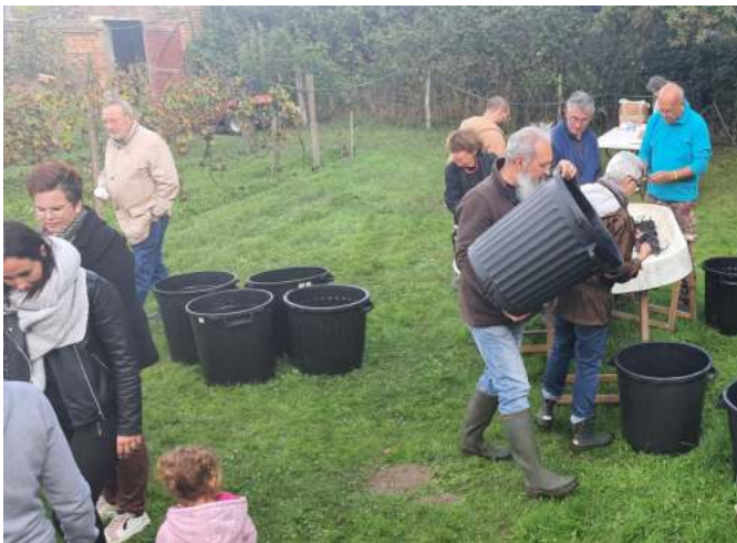
Au plus fort de l'action !!!