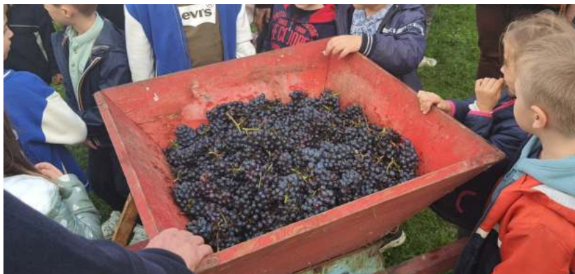
Découverte et fierté des petits vendangeurs