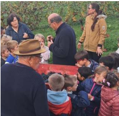
Tout d'abord, les explications à nos écoliers vendangeurs

*Association Culturelle et Viticole de la Saint Vincent