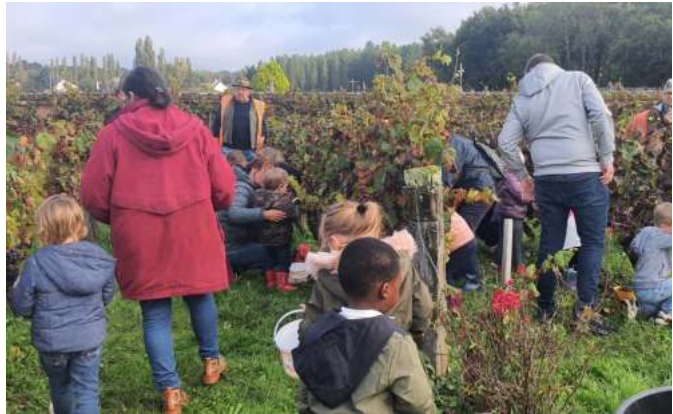
Les adultes accompagnent les enfants